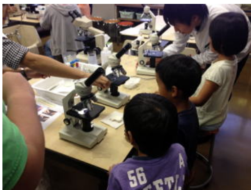
顕微鏡観察の様子